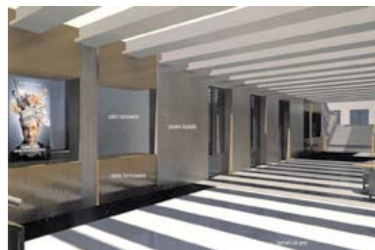
Wizualizacja hallu SOK w oświetleniu dziennym

Przypominamy, że zgodnie z przepisami ustawy o utrzymaniu czystości i porządku w gminach mieszkańcy zobowiązani są do złożenia deklaracji o wysokości opłaty za gospodarowanie odpadami komunalnymi. Termin upłynął 28 lutego, jednak część z Państwa nadal nie dopełniła tego obowiązku. Może to skutkować pociągnięciem do odpowiedzialności karnej skarbowej (art. 54 Kodeksu karnego skarbowego).