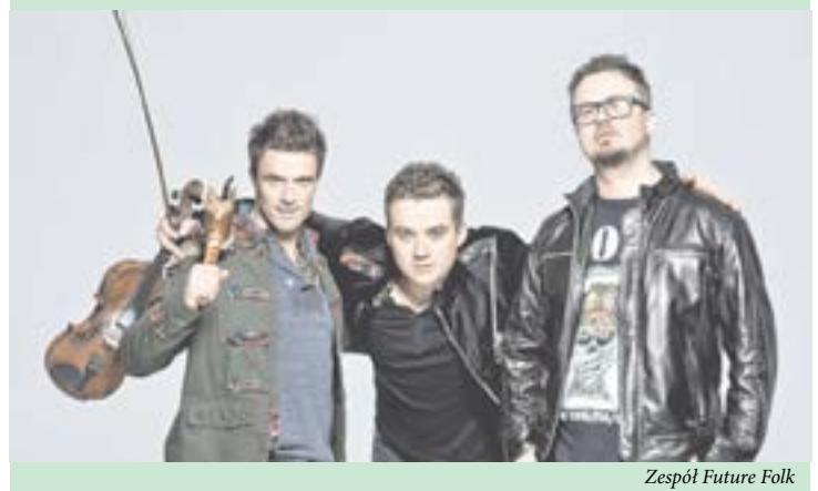
Zespół Future Folk

godz. 15:00 - 20:00 - Jarmark Sztuki Ludowej, Rękodzieła i Kuchni Regionalnej - Park im. Księcia Ogińskiego