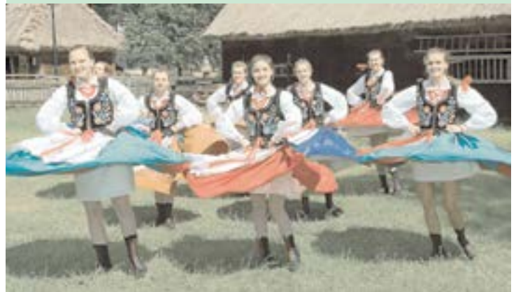
Zespół Pieśni i Tańca Sokołowianie z Sokołowa Podlaskiego